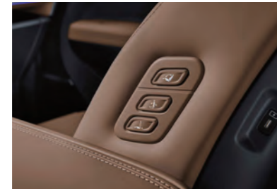
جهاز السماح بالدخول لمقعد الراكب