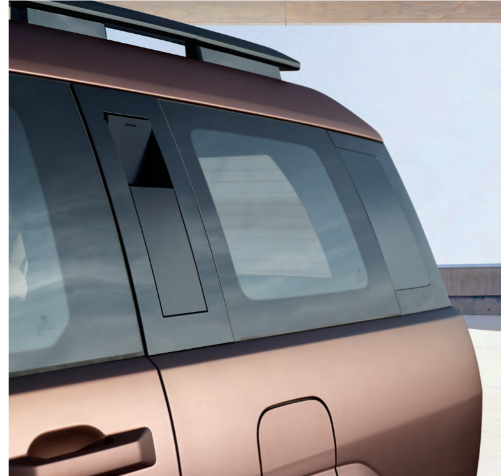
مقبض مساعد من النوع المخفي / ربع زجاجي