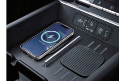
شاحن لاسلكي للهواتف الذكية (مفرد)