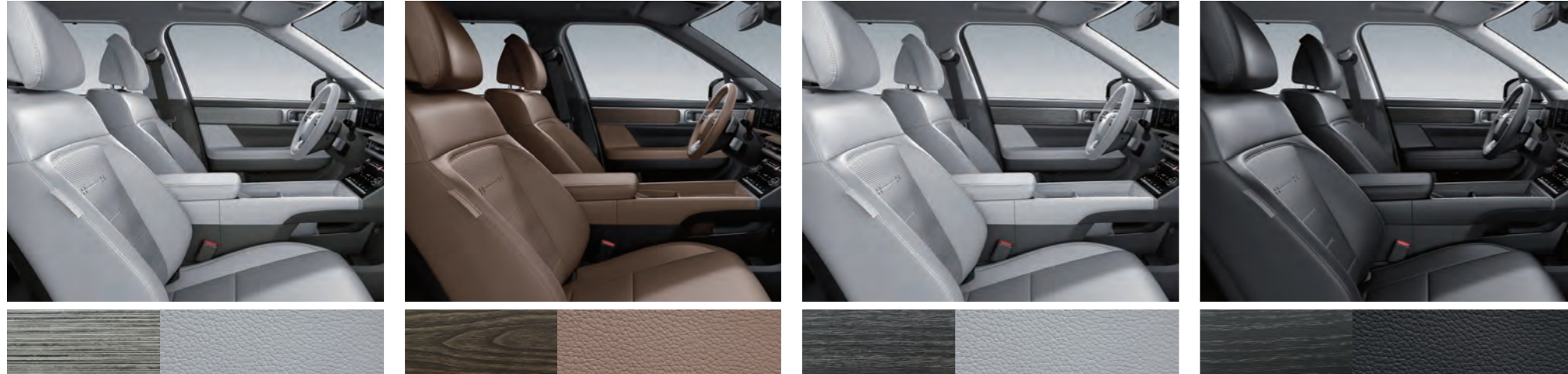
جلد أخضر غابي / زخرفة خفيفة مخططة من الأوكالبتوس