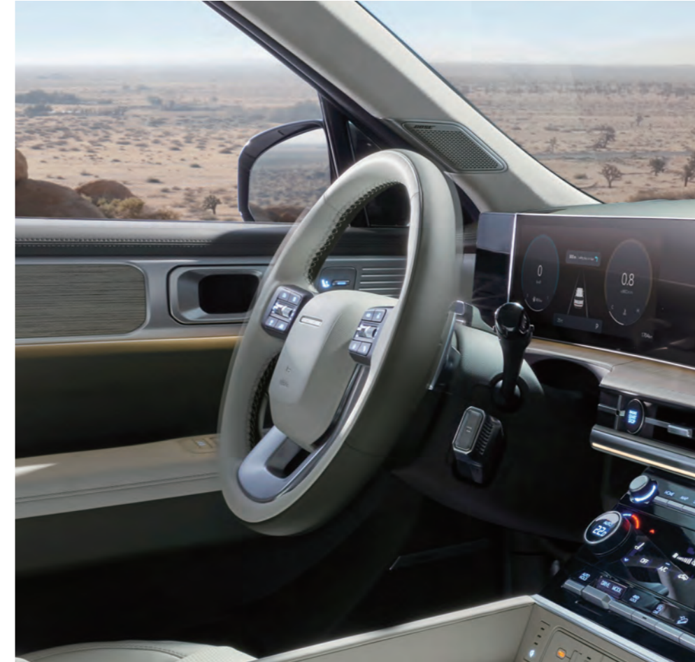
عجلة القيادة الحساسة