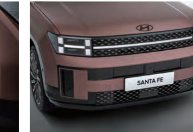
المبرد وشبكة السحب (كاليفرني)