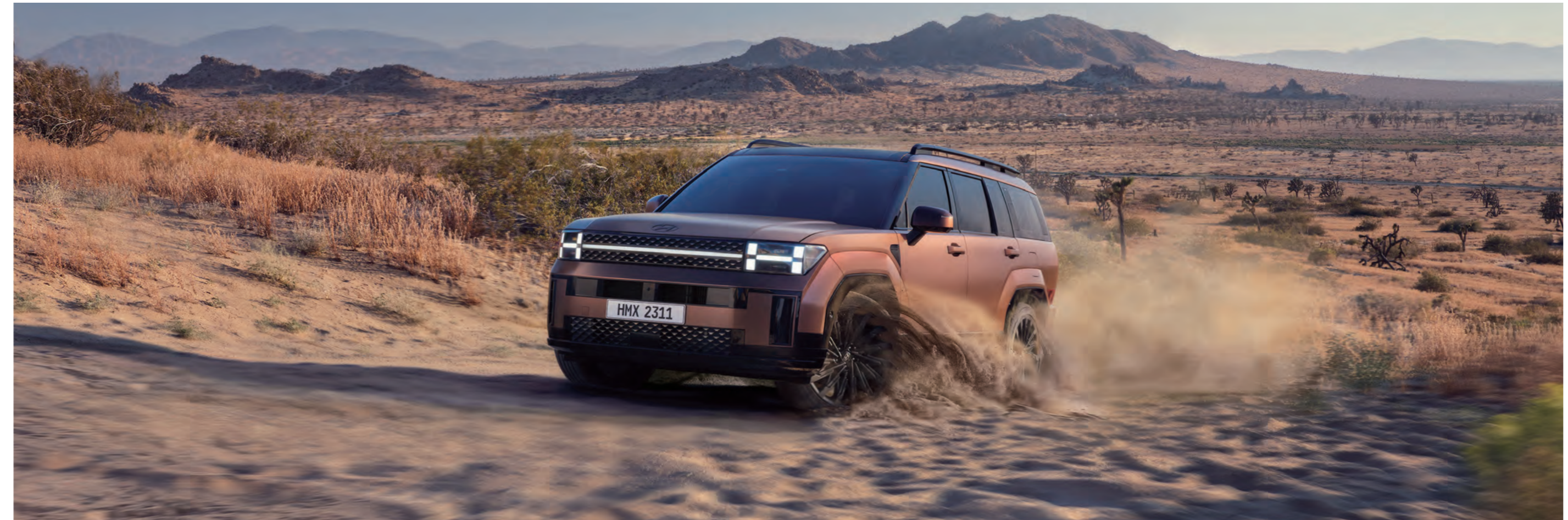
الدفع الرباعي HTRAC يوفر نظام الدفع الكلي للسانتا في أداء قيادة مثالي من خلال توزيع قوة الدفع بشكل فعال بين العجلات الأمامية والخلفية بناءً على مواقف القيادة المختلفة.