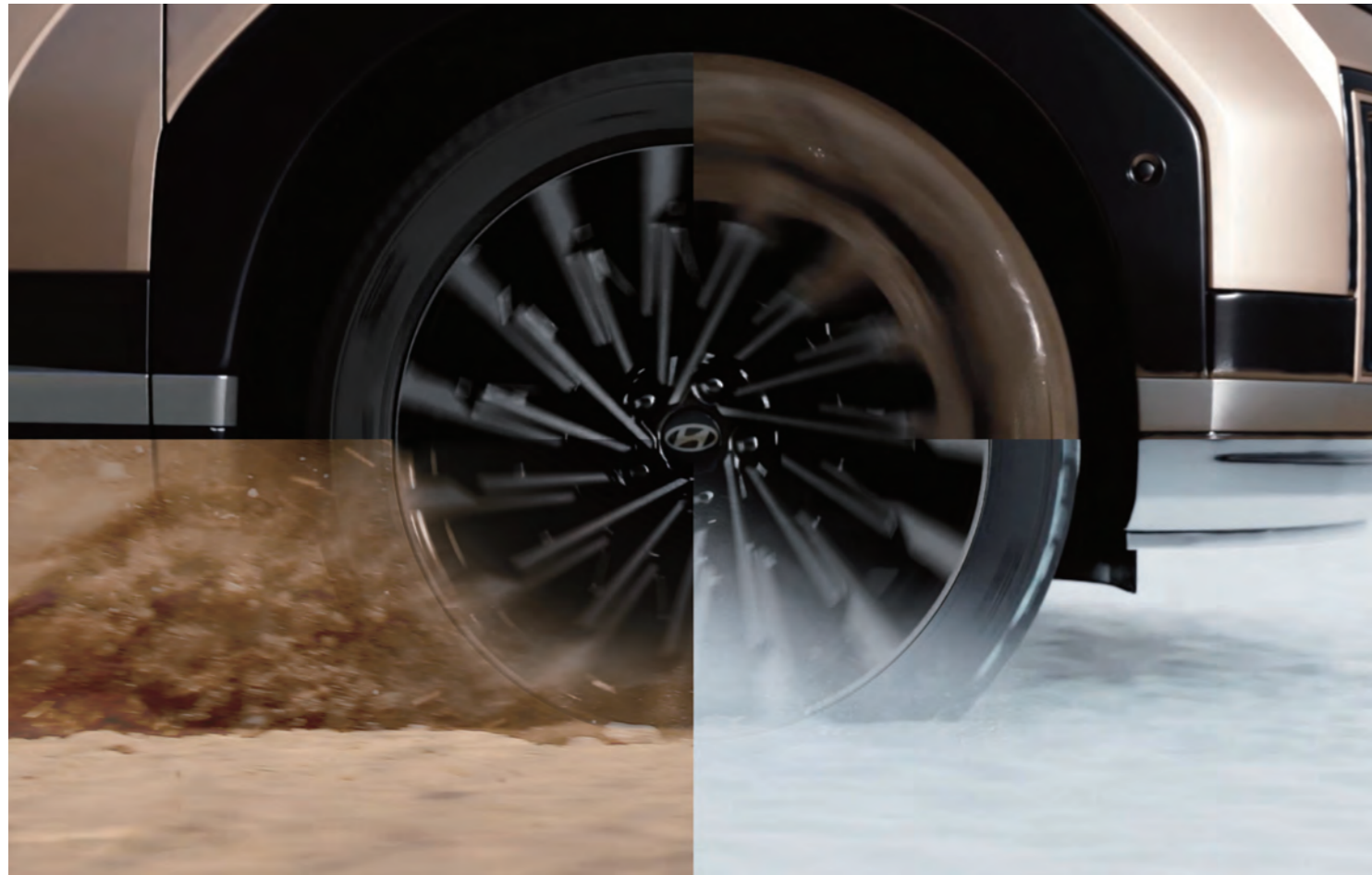
وضع القيادة / وضع التضاريس (تلقائي، طين، رملي، ثلج)

بنزين سمارت ستريم 194 الطاقة القصوى حصاناً/6,100 دورة في الدقيقة 25.1 أقصى عزم دوران كجم قوة م/4,000 دورة في الدقيقة محرك GDi 2.5 بنزين سمارت ستريم 281 الطاقة القصوى حصاناً/5,800 دورة في الدقيقة 43.0 أقصى عزم دوران كجم قوة م/1,700-4,000 دورة في الدقيقة محرك T-GDi 2.5