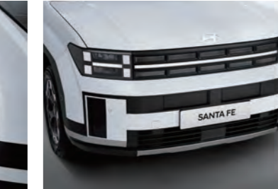
المبرد وشبكة السحب