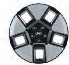
عجلات معدنية مقاس 18 بوصة (هجين/هايبرد)