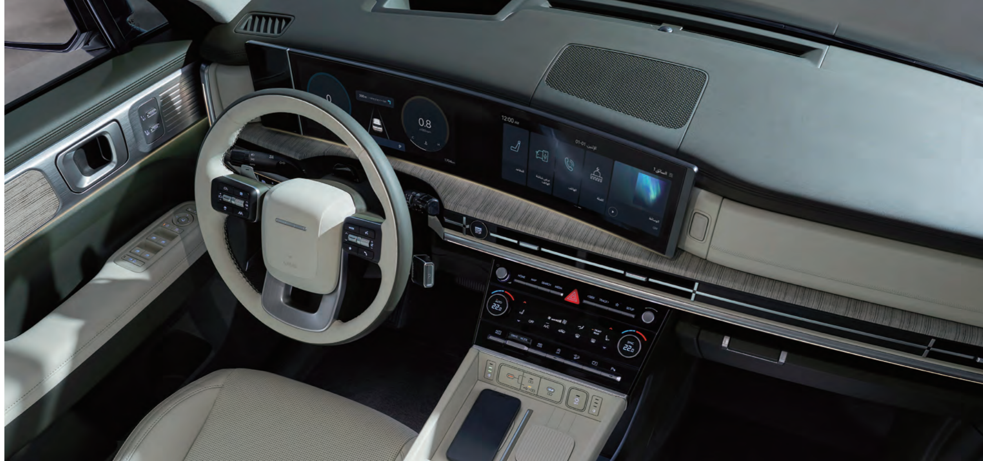
شاشة منحنية بانورامية 12.3 بوصة (مجموعة) + 12.3 بوصة (AVNT)

تم تصميمها لإضفاء طابع مريح وهادئ: التصميم الداخلي المتوازن بمثابة يمثل أعلى درجات الراحة الاستثنائية.