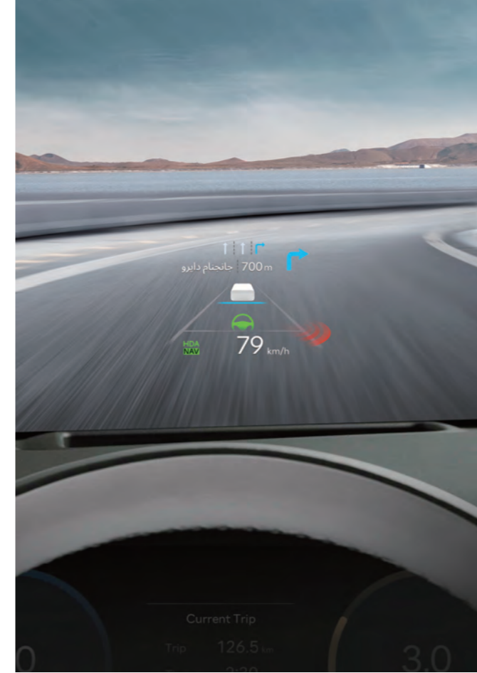
شاشة عرض أمامية مقاس 12 بوصة (HUD)