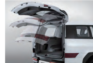
الباب الخلفي الكهربائي الذكي (ارتفاع قابل للتعديل)