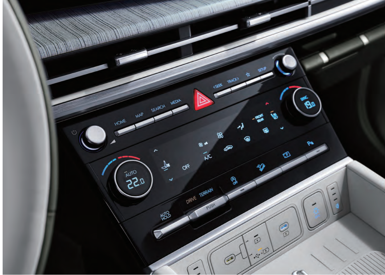
مقياس تحكم الحرارة التلقائي (ثنائي/مزدوج)

تعمل التكنولوجيا المتطورة على تحسين جودة رحلاتك.