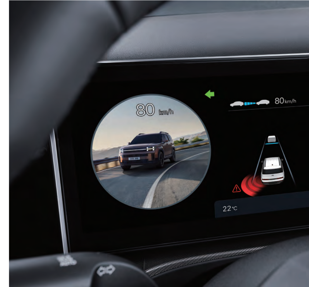
نظام مراقبة البقعة العمياء (BSM)