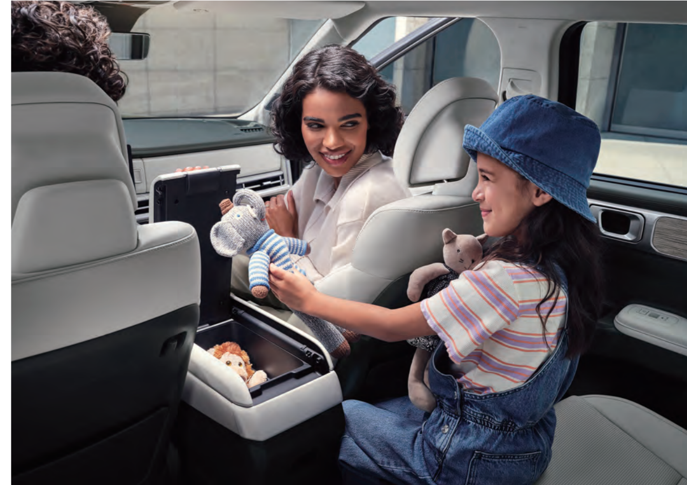
وحدة ختم ثنائية متعددة