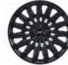
عجلات معدنية مقاس 21 بوصة (كاليفرني)