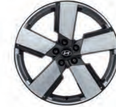
عجلات معدنية مقاس 20 بوصة (اختيارية)