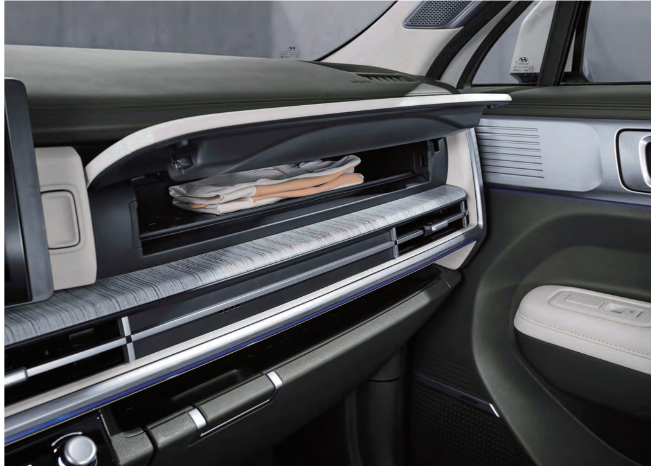
رف متعدد الاستخدامات للتعميم بالأشعة فوق البنفسجية

تم اختيار مجموعة متنوعة من مساحات التخزين بشكل إبداعي ودقيق للارتقاء برحلتك.