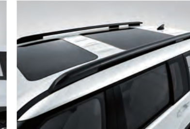
حاجز سقف من نوع الجسر / فتحة سقف مزدوجة