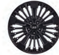
عجلات معدنية مقاس 20 بوصة (هجين/هايبرد - كاليفرني)