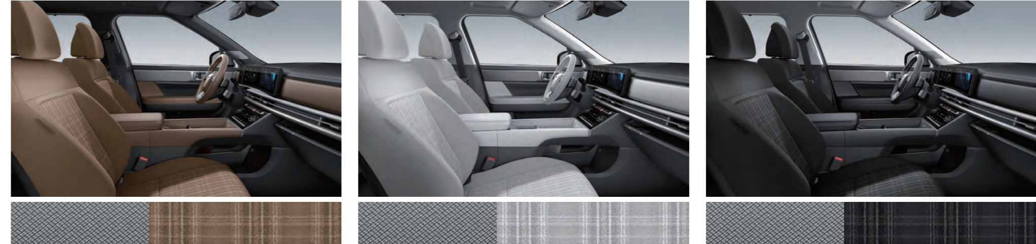
قماش البقان البني / زخرفة بنمط معدني