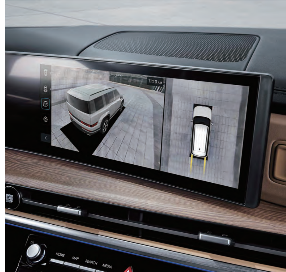
شاشة الرؤية المحيطة (SVM)