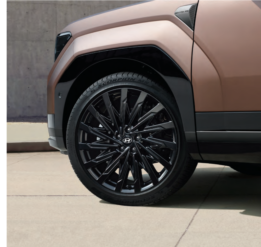
عجلات معدنية مقاس 21 بوصة / رفارف حادة