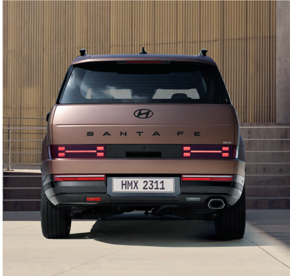
مجموعة مصابيح ليد خلفية

ذات طابع قوي من كل الزوايا. السانطا في الجديدة كلياً تتميز بوجود إضاءة فائقة وبراقة والتي تضيف لمسة من الجرأة للتصميم الانسيابي.