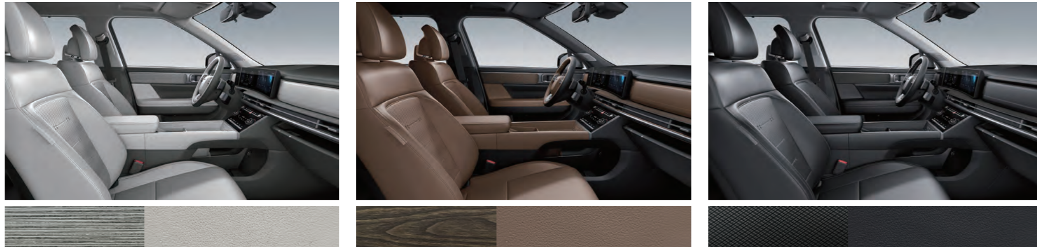
جلد نابا أخضر غابي / زخرفة خفيفة مخططة من الأوكالبتوس