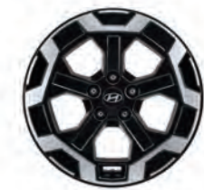
عجلات معدنية مقاس 18 بوصة (قياسية)