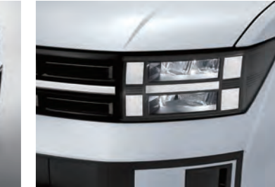
مصابيح أمامية LED كاملة (نوع MFR)