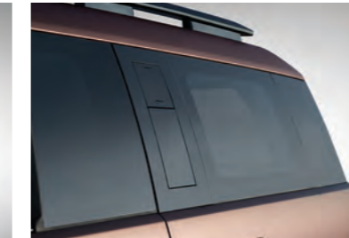
مقبض مساعد من النوع المخفي (كاليفرني)