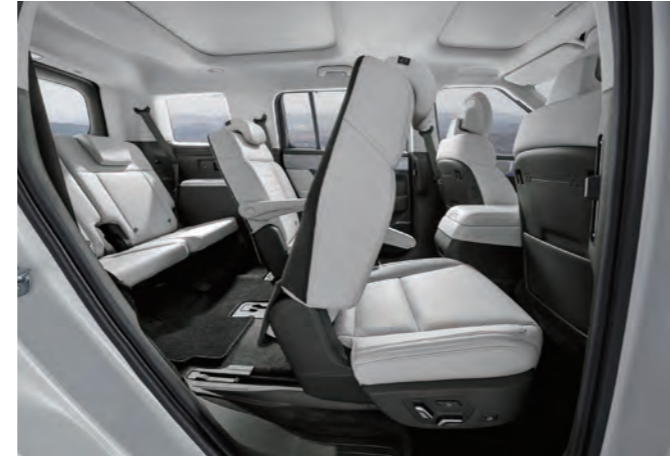
مقاعد الصف الثاني القابلة للطي والإخفاء الدخول بلمسة واحدة