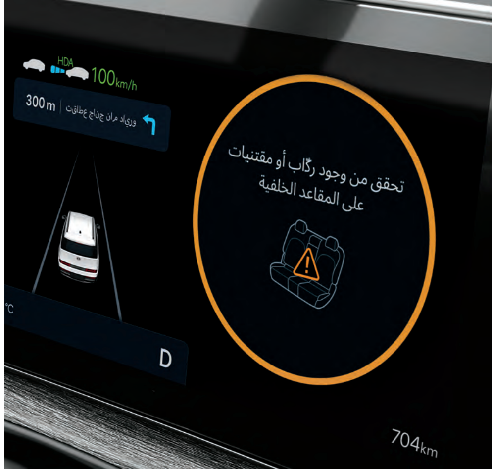
تنبيه الراكب الخلفي (ROA)

ستحافظ أحدث التحسينات بالنسبة للأمان على سلامة عائلتك في الأيام العادية وخلال المواقف الغير متوقعة.