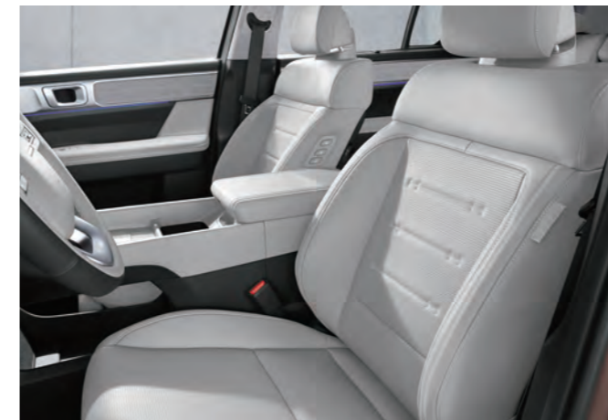
إضافة تفاعلية للأجواء المحيطة مقعد جلد نابا