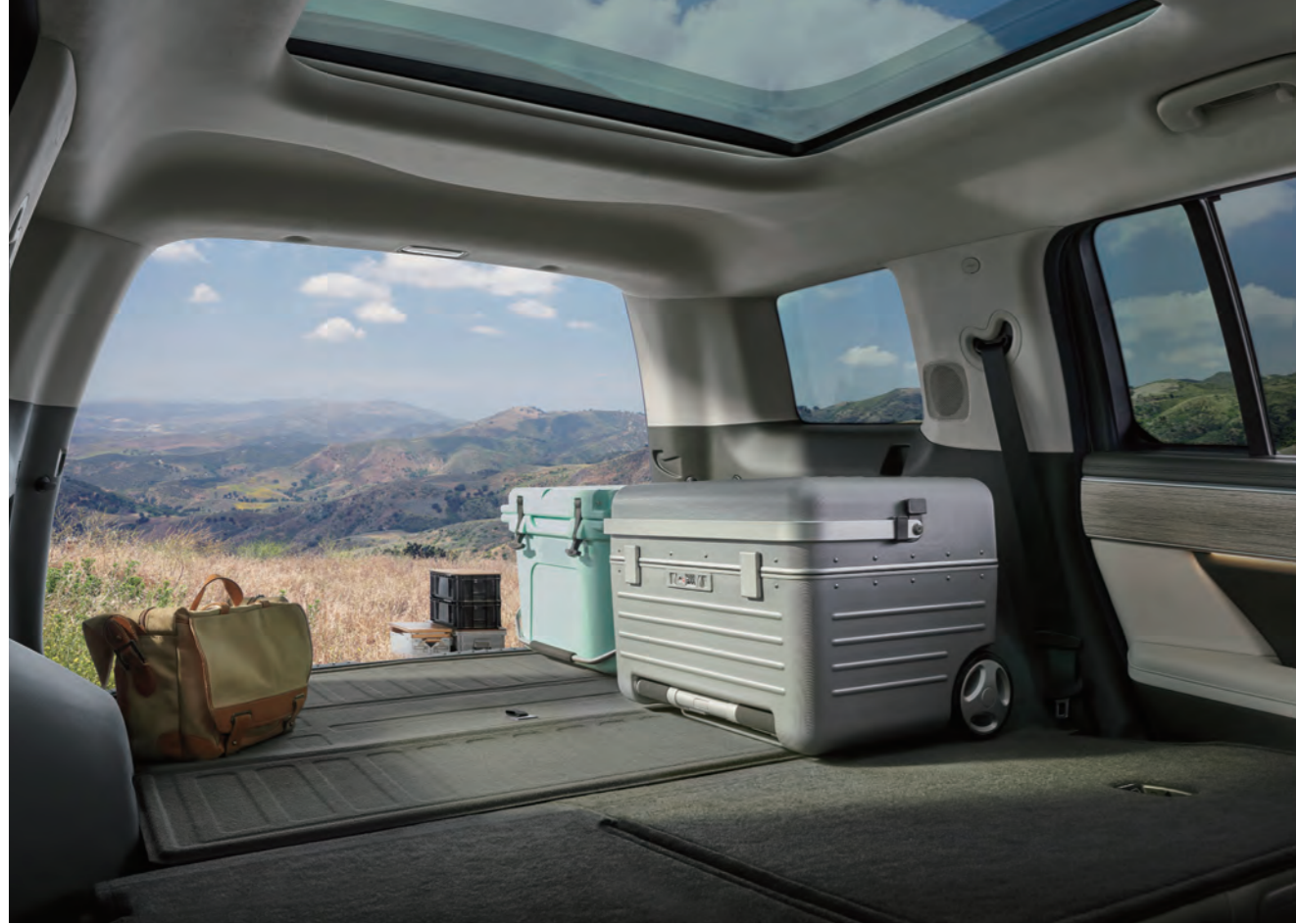
الطي والغمر في الصف الثاني

توفر سائنتا في الجديدة كلياً مجموعة مختارة مريحة من المقاعد ما يضمن أن تكون لحظاتك خلف الكواليس مرنة وجاهزة لأفاق جديدة.