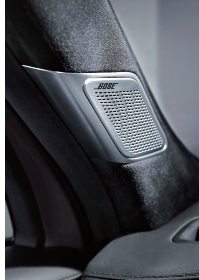
نظام الصوت الفاخر BOSE