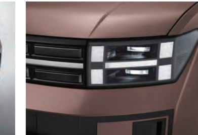
مصابيح أمامية LED كاملة (نوع الإسقاط)