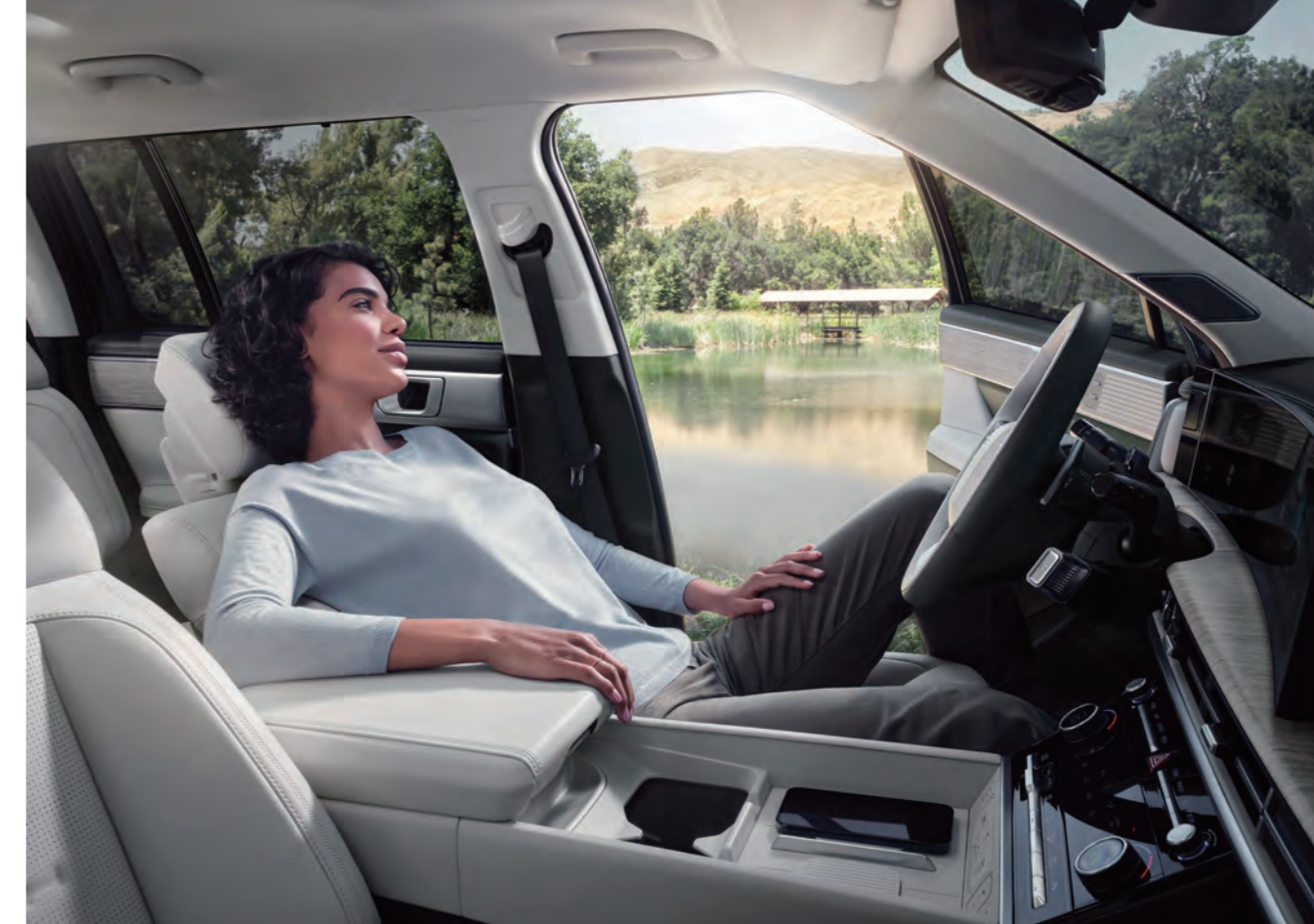
مقعد استرخاء أمامي مزود بمسند للسائقين