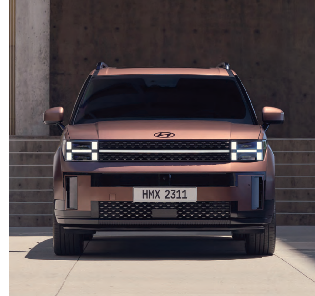
مصابيح H (ليد \ من فئة الإسقاط الضوئي) مصابيح أمامية