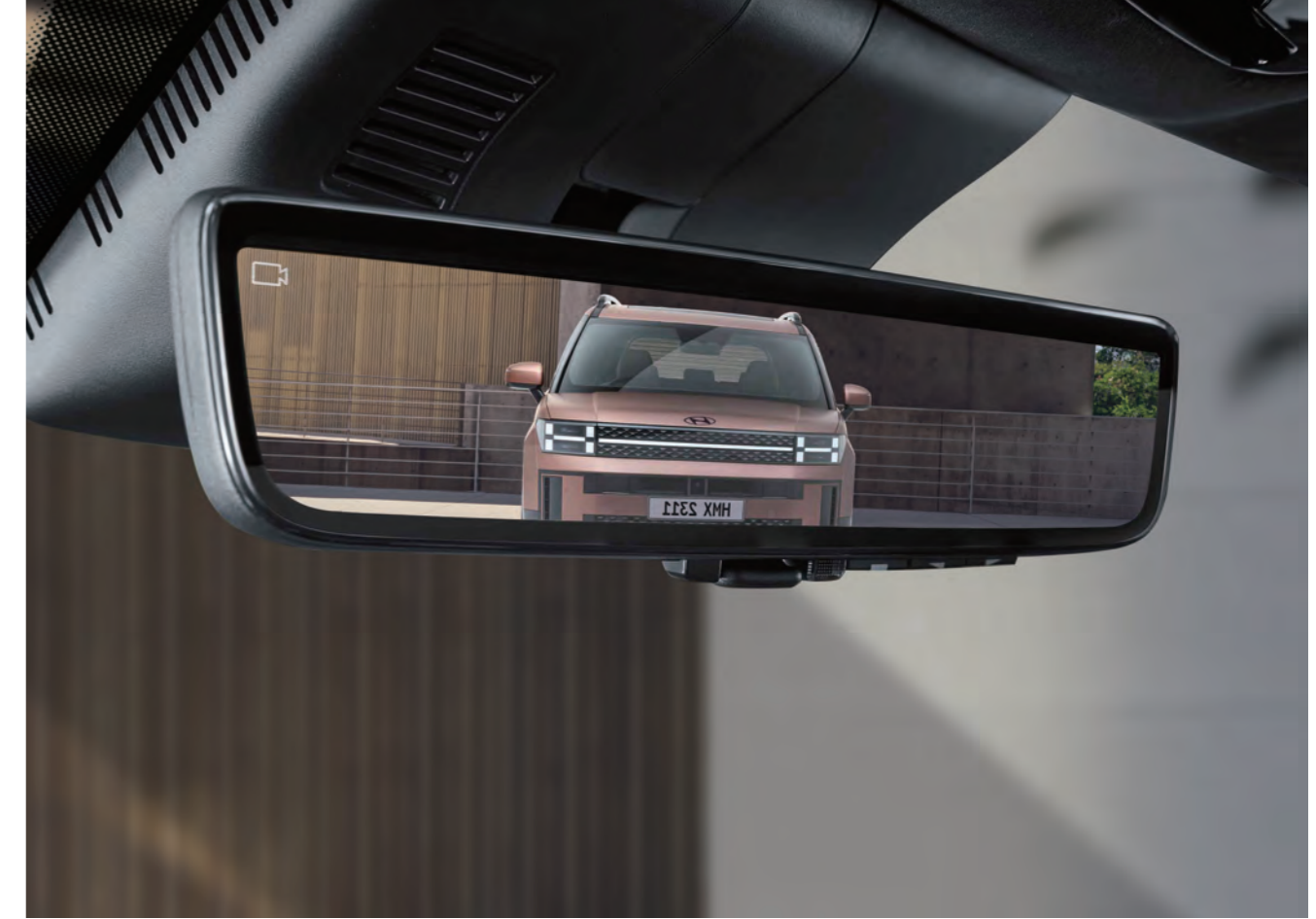
المرآة المركزية الرقمية (مرآة الرؤية الخلفية ذات الشاشة الكاملة)