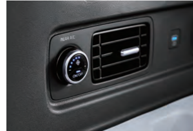
فتحة تهوية للصف الثالث