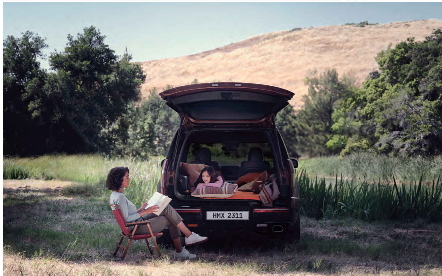
فتحة واسعة للباب الخلفي (فتح كهربائي)

ارفع الباب الخلفي بالكامل وافتحه لربط الداخل بالخارج. مما يوسع نطاق تجاربك اليومية.