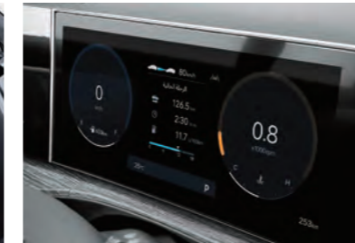
مجموعة شاشات LCD ملونة مقاس 12.3 بوصة