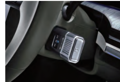
نقل من نوع العمود بالسلك (SPW)