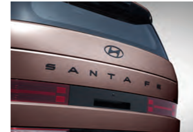
شعار أسود مغطى (شعار H - حروف)