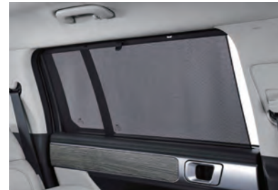
ستارة باب يدوية للصف الثاني