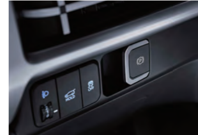
فرامل الانتظار الكهربائية (EPB)