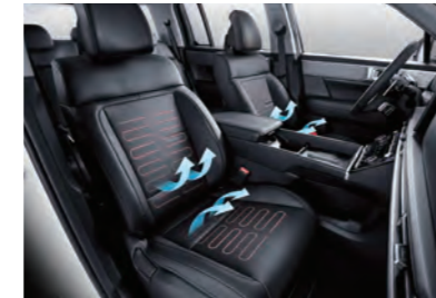
مقاعد أمامية مع تدفئة وتهوية