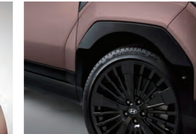
كسوة سوداء شديدة اللمعان (كاليفرني)