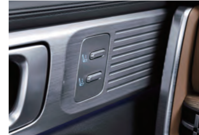
مقعد الذاكرة المتكامل